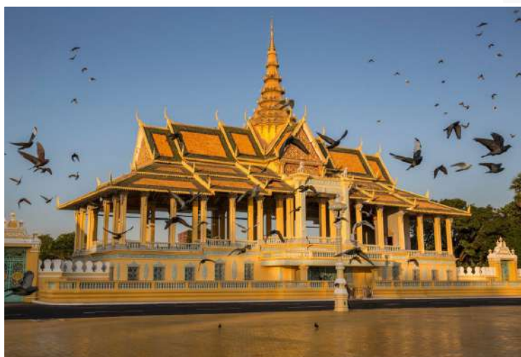
Phnom Penh - Βασιλικό Ανάκτορο

Το πρωί θα αναχωρήσουμε για τη Siem Reap περνώντας από επαρχιακές πόλεις, μικρά χωριά και γραφικά τοπία. Αφίξη στη Siem Reap και μετάβαση στο λόφο Rnhom Bakheng , όπου βρίσκεται και ο ομώνυμος ναός του 10ου αιώνα για να θαυμάσουμε από εκεί την εκπληκτική Θέα του Angkor Wat με φόντο το ηλιοβασίλεμα . Μεταφορά στο ξενοδοχείο μας για δείπνο και διανυκτέρευση.