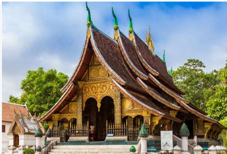
Luang Prabang - Wat Xieng Thong