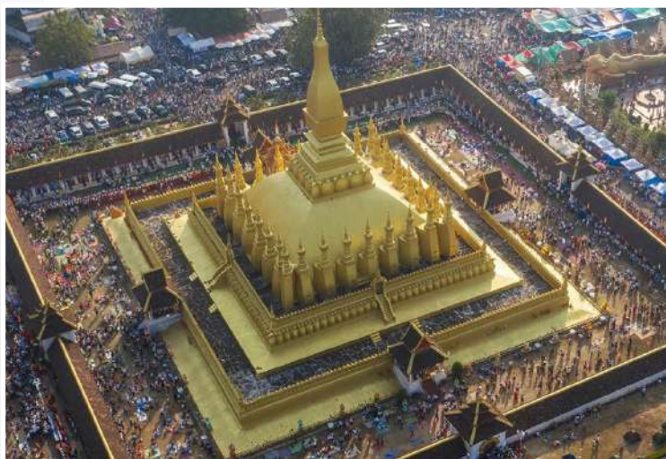
Vientiane - That Luang