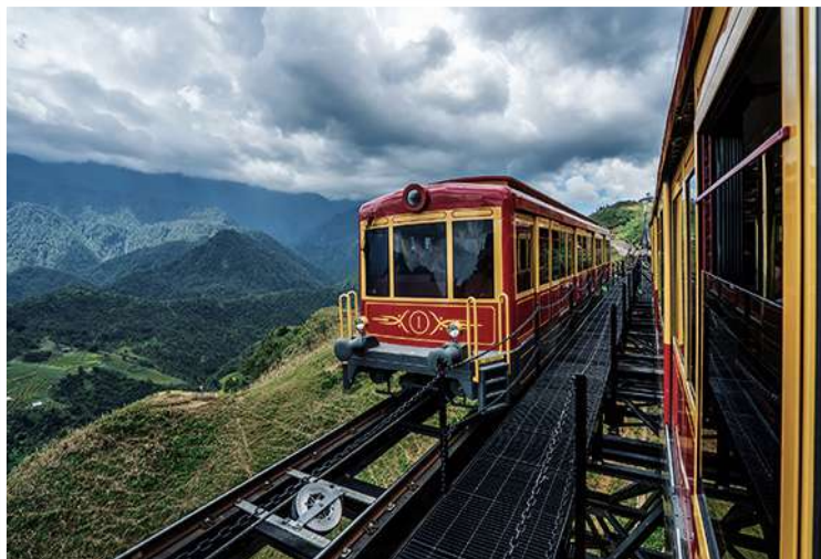
Τρένο για την Σάπα

τον παραδοσιακό τρόπο ζωής τους. Στη συνέχεια θα πάρουμε το δρόμο της επιστροφής (6 ώρες) διασχίζοντας το βόρειο Βιετνάμ για να επιστρέψουμε στο Hanoi . Δείπνο και διανυκτέρευση