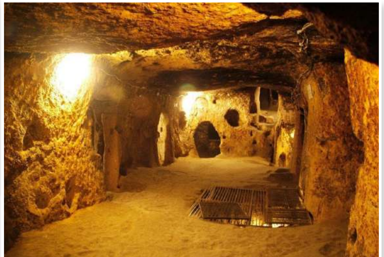
Τούνελ Cu Chi