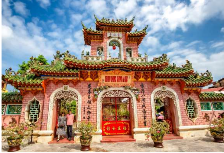
Κινέζικος Ναός - Hoi An