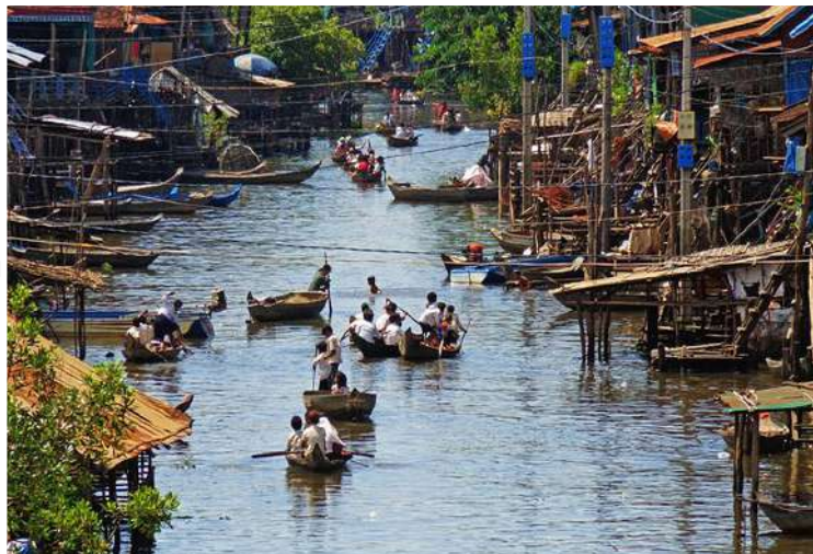
Πλωτό χωριό Kompong Khleang - Λίμνη Tonle Sap

αγάλματα κάθε είδους και μεγέθους, τα οποία αποτελούν αφιερώματα των πιστών. Στη διαδρομή της επιστροφής θα απολαύσουμε το εκπληκτικό ηλιοβασίλεμα στον ποταμό Mekong , ενώ στη συνέχεια θα έχουμε την ευκαιρία να περιηγηθούμε στην εντυπωσιακή νυχτερινή αγορά της πόλης. Δείπνο σε τοπικό εστιατόριο.