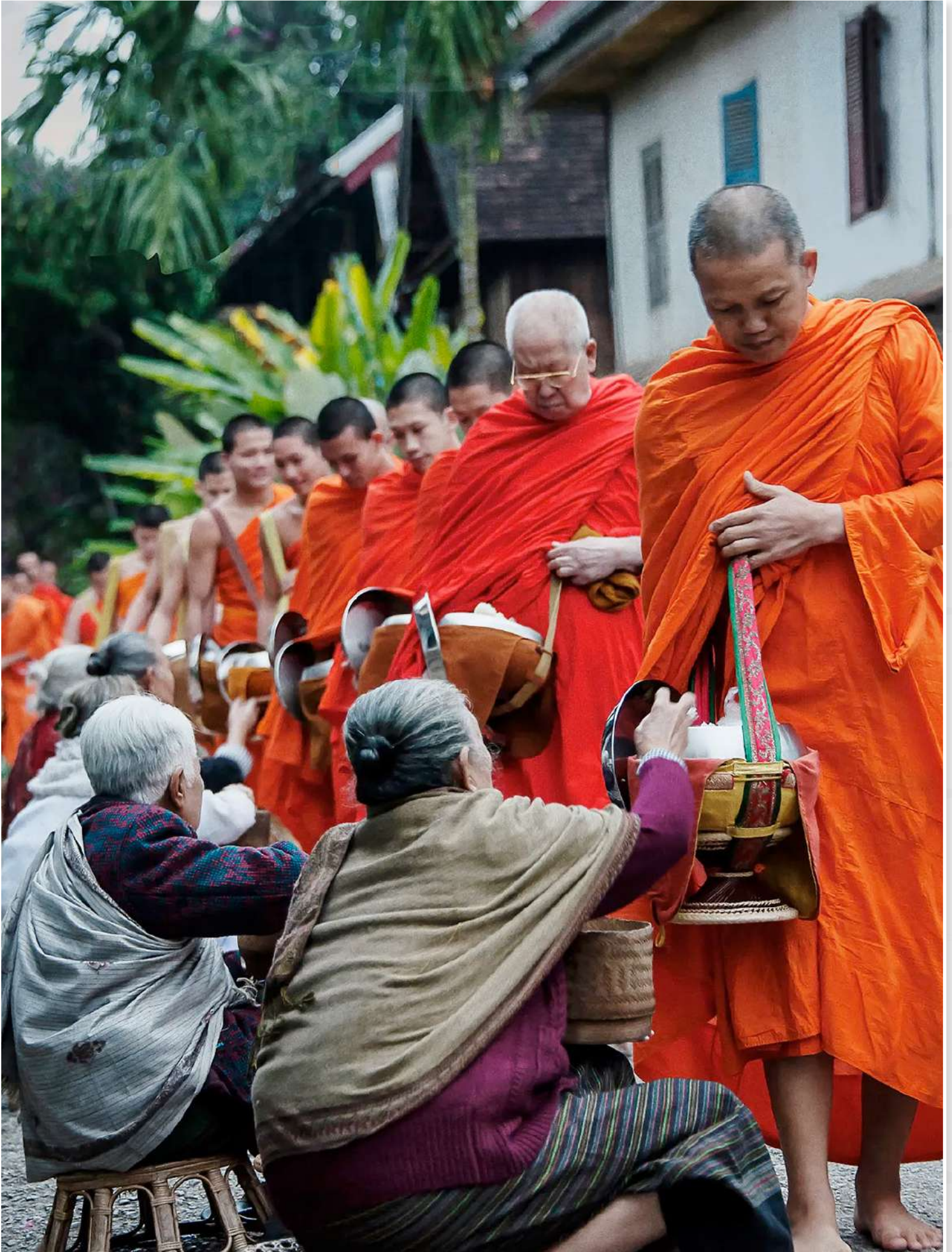
Luang Prabang - Το γεύμα των μοναχών