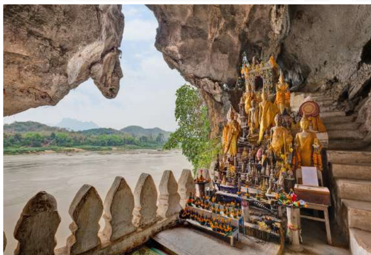
Σπήλαια Pak Ou

Σήμερα θα ξυπνήσουμε πολύ νωρίς το πρωί για να πάμε στο κέντρο της πόλης, όπου μαζεύονται οι βουδιστές μοναχοί με τα ταμπά τους για να παραλάβουν τρόφιμα από τους πιστούς, τα οποία θα είναι και η τροφή τους για όλη την ημέρα. Πρόκειται για ένα αρχαίο έθιμο, σύμφωνα με το οποίο οι πιστοί προσφέρουν φαγητό (κυρίως ρύζι) στους μοναχούς για να μπορούν οι τελευταίοι να αφιερώνονται στην ασκητική ζωή, την προσευχή και το διαλογισμό. Αφού επιστρέψουμε στο ξενοδοχείο για πρωινό, θα συνεχίσουμε με επισκέψεις σε όλα τα σημαντικά μνημεία της Luang Prabang (UNESCO), όπως το ναό Wat Aham , τον Wat Mai , τον Wat Xieng Thong , τον Wat Visoun και το Εθνικό Μουσείο (πρώην Βασιλικό Παλάτι). Το απόγευμα θα ανηφορίσουμε στο λόφο Phousi , όπου βρίσκεται ο ομώνυμος ναός για να απολαύσουμε την εκπληκτική θέα . Στη συνέχεια θα μεταφερθούμε στο σιδηροδρομικό σταθμό για να πάρουμε το τρένο μας για την Βιεντιάν ( C81 19.22 - 21.08 ). Αφίξη στο ξενοδοχείο μας στην Βιεντιάν για δείπνο και διανυκτέρευση.