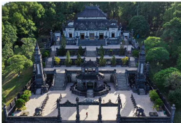
Hue - Ο τάφος του Khai Dinh

Μεταφορά νωρίς το πρωί στο αεροδρόμιο με προορισμό την αυτοκρατορική πρωτεύουσα Hue (VN6317 10 MAR HAN HUI 08.00 09.15) . Ξεκινάμε την ξενάγησή μας με επίσκεψη στους δύο σπουδαιότερους τάφους των αυτοκρατόρων της δυναστείας Nguyen, Khai Dinh , και Tu Duc , οι οποίοι αποτελούν σημαντικά ιστορικά μνημεία της ακμείας αυτοκρατορικής περιόδου του Βιετνάμ. Δεσπόζουν σε πανέμορφα φυσικά τοπία πλάι σε λίμνες και ποτάμια και φημίζονται για την τέχνη τους και την αρχιτεκτονική τους. Συνεχίζουμε την ξενάγησή μας στην ιστορική αυτή πόλη με μία όμορφη βαρκάδα στον ποταμό των αρωμάτων (Perfume River) για να καταλήξουμε στην 7οροφη Παγόδα Thien Mu . Δείπνο σε τοπικό εστιατόριο πριν καταλήξουμε στο ξενοδοχείο μας.