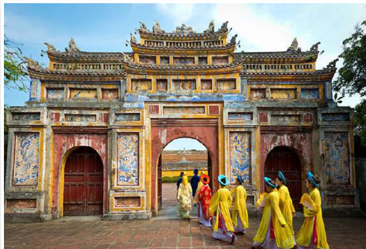
Hue - Αυτοκρατορική Πόλη