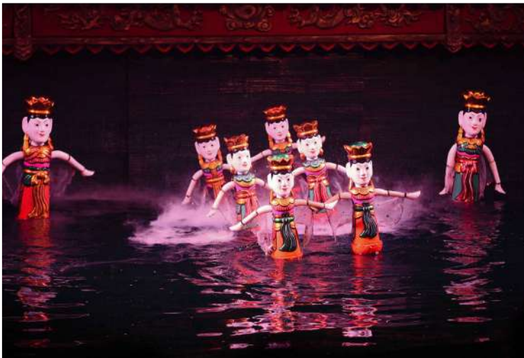
Παραδοσιακές μαριονέτες στο νερό

Μετά το πρωινό θα αναχωρήσουμε για το Halong Bay (UNESCO) για να πραγματοποιήσουμε μία 4ωρη κρουαζιέρα στο μαγευτικό αυτό τοπίο. Για να έχουμε μία πιο ολοκληρωμένη εμπειρία έχουμε ναυλώσει ένα κρουαζιερόπλοιο προκειμένου να απολαύσουμε την περιήγησή μας στον κόλπο Τόνκιν, που περιβάλλεται από καταπράσινους, ασβεστολιθικούς σχηματισμούς και ψηλές βραχονησίδες. Στην κρουαζιέρα αυτή θα προσεγγίσουμε τις νησίδες Dinh Huong, Cho Da (νησίδα του Πέτρινου Σκύλου) & Trong Mai (νησίδα του Μαχόμενου Κόκκορα) , θα έχουμε την ευκαιρία να επισκεφθούμε την περιοχή Va Hang με παραδοσιακό βαρκάκι από μπαμπού ή κάνοντας καγιάκ και θα εξερευνήσουμε το μοναδικό σπήλαιο Thien Cung . Επίσης, δεν θα παραλείψουμε να απολαύσουμε μεσημεριανό γεύμα εν πλω . Αφού αποβιβαστούμε στην ακτή θα επιστρέψουμε στο Hanoi , όπου θα έχουμε τη ευκαιρία να παρακολουθήσουμε παραδοσιακή παράσταση με μαριονέτες στο νερό , βασικό στοιχείο του βιετναμέζικου πολιτισμού. Μεταφορά στο ξενοδοχείο μας για διανυκτέρευση.