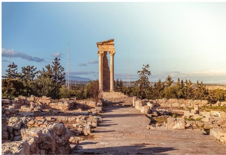
Αρχαίο Κούριο - Ιερό του Απόλλωνα Υλάτη

Μετά το πρωινό περιήγηση δυτικώς της Λεμεσού, με πρώτη στάση στον αρχαιολογικό χώρο Κουρίου , με κατάλοιπα από την ύστερη κλασική ως το τέλος της παλαιοχριστιανικής περιόδου (ρωμαϊκή αγορά, οικίες με ψηφιδωτά δάπεδα, λουτρά, θέατρο, στάδιο, ναό του Απόλλωνος Υλάτου, τρεις βασιλικές). Μετάβαση στο Κολόσσι και επίσκεψη στον Πύργο των Ιωαννιτών Ιπποτών (1454), που κτίστηκε για την προστασία των φυτειών ζαχαροκάλαμου και βαμβακιού των Σταυροφόρων. Επιστροφή στη Λεμεσό και ξενάγηση στο Φρούριο της Λεμεσού (περ.1590) και το Μεσαιωνικό Μουσείο στο εσωτερικό του, με εκθέματα από τον 3ο ως το 18ο αι., καθώς και στο βραβευμένο Μουσείο Χαρουπόμυλου Λανίτη . Δείπνο σε τοπικό εστιατόριο.