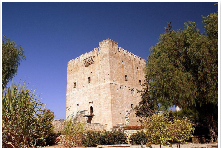
Κολόσσι - Ο Πύργος των Ιπποτών