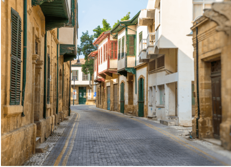
Λευκωσία - Παλιά Πόλη

συνέχεια περιήγηση στο ιστορικό κέντρο , με στάσεις στην Πύλη Αμμοχώστου , την πιο σπουδαία από τις πύλες της οχύρωσης της Βενετοκρατίας, στον καθεδρικό ναό του Αγίου Ιωάννη , το ναό της Οδηγητριάς (νυν μπεζεστένι) και το ναό του Αρχαγγέλου Μιχαήλ Τρυπιώτη . Το μεσημέρι στάση για φαγητό σε τοπικό εστιατόριο στο κέντρο της παλιάς Λευκωσίας. Στη συνέχεια μετάβαση στην κατεχόμενη πλευρά της πόλης, προκειμένου να ολοκληρωθεί η εικόνα της διχοτομημένης πρωτεύουσας με στάσεις μεταξύ άλλων, στον πρώην καθολικό καθεδρικό ναό της Αγίας Σοφίας (νυν Τζαμί Σελιμιγιέ), ένα από τα σημαντικότερα δείγματα γοθτικής αρχιτεκτονικής στην Κύπρο, το ναό της Θεοτόκου της Τύρου (Αρμενίων) και το Büyük Han (Μεγάλο Χάνι), το μεγαλύτερο καραβανσεράι του νησιού. Μεταφορά στο ξενοδοχείο και διανυκτέρευση.