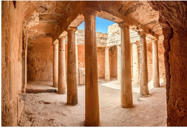
Πάφος - Τάφοι των Βασιλέων

Χρυσοπολίτισσας –από τους αρχαιότερους παλαιοχριστιανικούς ναούς της Κύπρου (4ος αι.)– και τους διαδοχικούς ναούς στην ίδια θέση και στη συνέχεια στον αρχαιολογικό χώρο που περιλαμβάνει μνημεία από την προϊστορική ως και τη μεσαιωνική περίοδο, μεταξύ των οποίων τα περίφημα ψηφιδωτά δάπεδα των ρωμαϊκών επαύλεων (2ος-5ος αι.) και η νεκρόπολη με τους τάφους των Βασιλέων (2ος π.Χ.-2ος μ.Χ. αι.). Επιστροφή στη Λεμεσό και δείπνο σε τοπικό εστιατόριο.