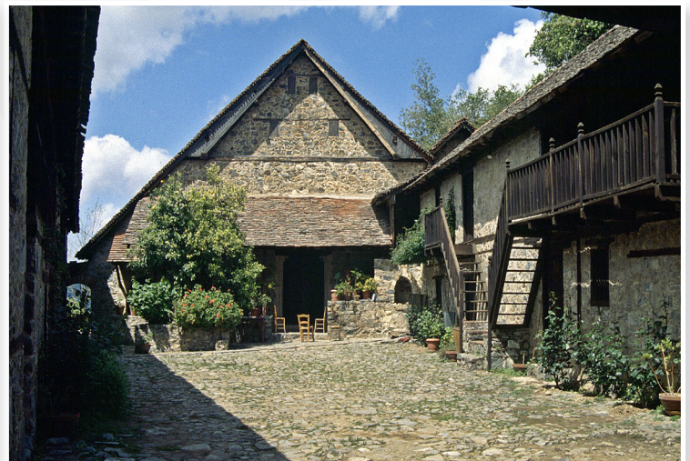
Ιερά Μονή του Αγίου Ιωάννη Λαμπαδιστού