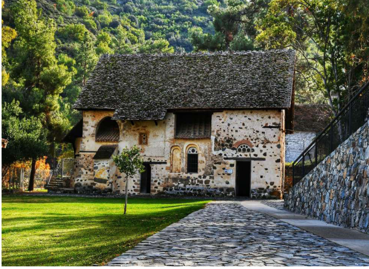
Ναός του Αγίου Νικολάου Στέγης

εισβολής του 1974. Άνοδος στις πλαγιές του όρους Τρόδος και ξενάγηση σε τρεις βυζαντινούς ναούς που έχουν ανακηρυχθεί Μνημεία Παγκόσμιας Κληρονομιάς της UNESCO. Πρώτη στάση ο ναός της Παναγίας Ασίνου (Παναγία Φορβιώτισσα) (1099), με εξαιρετικές τοιχογραφίες κωνσταντινουπολίτικου εργαστηρίου του 12ου αι., δείγματα της πρωτοπορίας της εποχής των Κομνηνών. Στη συνέχεια ο ναός του Αγίου Νικολάου Στέγης (11ος αι.), με ζωγραφικό διάκοσμο διαφόρων φάσεων από τον 11ο ως και το 17ο αι. Τελευταία στάση η μεσοβυζαντινή μονή της Παναγίας του Άρακος , τους τοίχους της οποίας κοσμούν κορυφαία έργα της κομνηνικής περιόδου (1192). Γεύμα σε τοπική ταβέρνα. Μεταφορά στο ξενοδοχείο και διανυκτέρευση.