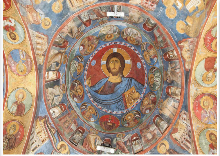
Ιερά Μονή της Παναγίας του Άρακα