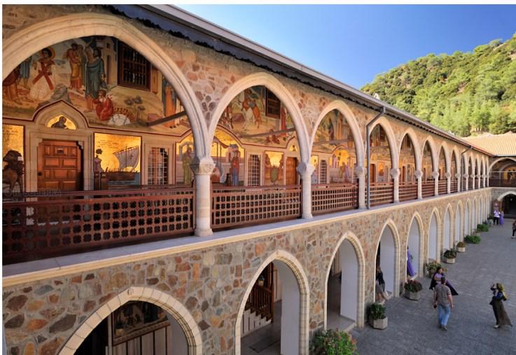
Μονή Παναγίας του Κύκκου

Ολοήμερη εκδρομή στο Τρόδος και γνωριμία με τα ορεινά καταπράσινα θέρετρα της Κύπρου, με τους σπουδαιούς σπαρτώνες και αμπελώνες. Περιήγηση στο διασημότερο μοναστηριακό συγκρότημα του νησιού, την Παναγία του Κύκκου , με εντυπωσιακό πλούτο κειμηλίων και αντικειμένων που μετά την εισβολή εντοπίστηκαν στο εξωτερικό, αγοράστηκαν από την Εκκλησία της Κύπρου και επαναπατρίστηκαν. Στη συνέχεια επίσκεψη στη Μονή Αγίου Ιωάννη Λαμπαδιστή –με τοιχογραφίες του 13ου-14ου, αλλά και 15ου αι. με έντονες δυτικές επιδράσεις– και τους ναούς της Θεοτόκου του Μουτουλλά (1280) και του Αρχαγγέλου Μιχαήλ Πεδουλά , με σημαντικό γραπτό τέμπλο και τοιχογραφίες του 1474 (και τα τρία μνημεία UNESCO). Τελευταία στάση το παραδοσιακό χωριό Όμοδος στη μέση της μεγαλύτερης περιοχής αμπελώνων του νησιού και ξενάγηση σε τοπικό οινοποιείο . Δείπνο σε παραδοσιακή ταβέρνα, επιστροφή στο ξενοδοχείο και διανυκτέρευση.