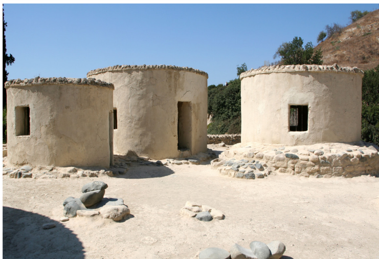
Νεολιθικός Οικισμός Χοιροκοιτίας

Μετά το πρωινό μετάβαση στο παραδοσιακό χωριό Λεύκαρα , γνωστό για τα ιδιαίτερα χειροποίητα λευκαρίτικα κεντήματα, που εντάχθηκαν στον παγκόσμιο Κατάλογο Άυλης Πολιτιστικής Κληρονομιάς της UNESCO. Επόμενη στάση ο οικισμός της Χοιροκοιτίας , ένας εκ των πρωιμότερων και ο καλύτερα σωζόμενος οικισμός της νεολιθικής περιόδου στο νησί, με κατοίκηση από την 7η ως τις αρχές της 4ης χιλιετίας π.Χ. (μνημείο UNESCO). Επίσκεψη στην Παναγία Αγγελόκτιστη (υποψ. UNESCO) (5ος/11ος αι.), με τοιχογραφίες του 13ου και το περιώνυμο παλαιοχριστιανικό ψηφιδωτό που σώζεται στην κόγχη. Μεταφορά στη Λάρνακα και επίσκεψη στο ναό του Αγίου Λαζάρου , κτίσμα των μεσοβυζαντινών χρόνων πάνω από δύο παλαιότερους ναούς και κατά παράδοση τον τάφο του αγίου, με προσθήκες του 15ου-16ου και 19ου αι., που μετατράπηκε διαδοχικώς σε καθολικό λατινικής μονής, μουσουλμανικό τέμενος, ναό μικτής χρήσης Λατίνων-Ορθοδόξων. Περίπατος στην παραλιακή λεωφόρο των «Φοινικούδων». Αναχώρηση για το αεροδρόμιο της Λάρνακας και πτήση για Αθήνα. Αφιξη στο Ελ. Βενιζέλος στις 21.35. GQ 603 29 MAR LCA ATH 1950 2135